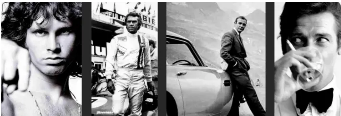
Lässige Ikonen der Popkultur: Der junge Jim Morrison mit tiefem Blick, Steve McQueen beim Autorennen, Sean Connery am Beginn seiner Karriere als James Bond Darsteller und sein Nachfolger Roger Moore.