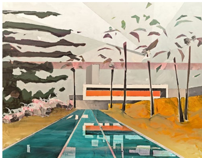
THOMAS LUNAU, IN TO THE GREEN GARDEN OF SECRETS, 2022, PAINTING, OIL ON CANVAS, FRAMED WITH SHADOW GAP, 70 X 100 CM, COURTESY OF KUNST FÜR ANGELN E.V. © THOMAS LUNAU

„Kunst og musik er et sprog, som alle forstår. Derfor er foreningen KUNST FÜR ANGELN rigtig glade for at kunne kombinere disse to kunstarter med hinanden, med andre ord, at vise kunst, hvor der spilles klassisk musik og at opleve klassisk musik, hvor der udstilles kunst. Både i Danmark her til august og på den tyske side i oktober. ART & MUSIC OVERCOME BOUNDARIES giver folk en ny fantastisk mulighed for at opleve det mangfoldige kulturliv i den dansk-tyske grænseregion. Og fra nu af vil muligheden byde sig HVERT ÅR!"