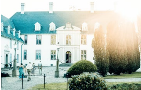
TOP: HACKENBORG SCHLOSS OUTSIDE VIEW, PHOTO: © ANDREJ GRILC DANISH CLARINET TRIOS & FOUNDER OF THE SCHACKENBORG MUSIC FESTIVAL, MARTIN QVIST HANSEN / PIANO, TOMMASO LONQUICH / CLARINET, JONATHAN SLAATTO / CELLO, PHOTO: © ANDREJ GRILC