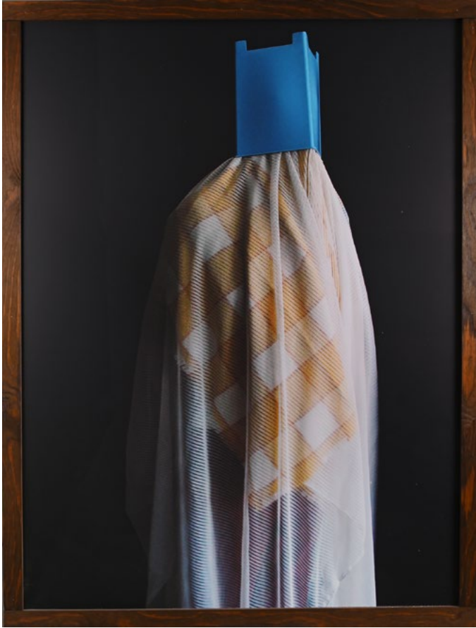
THORSTEN BRINKMANN, LOUIS ROYAL , 2008, 133 X 100 CM, PHOTOGRAPHY, WOODEN FRAMED, 1/5 + 2AP, COURTESY OF KUNST FÜR ANGELN E.V. © LENNART GRAU